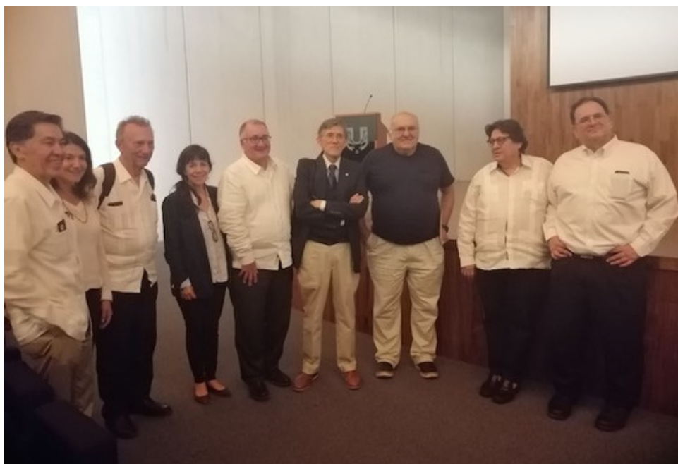
● Participantes del Simposio SIIES

Los conferencistas coincidieron en que México tendrá un desarrollo sobresaliente al contar con una sociedad educada e informada, y eso solamente se alcanzará al brindar un empuje significativo al conocimiento científico, es decir sin escatimar la inversión en ciencia, tecnología e investigación.