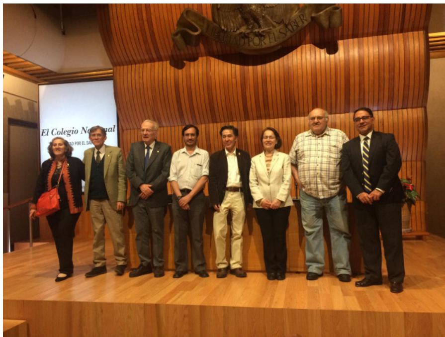
● Participantes Simposio de la gran explosión al surgimiento de las civilizaciones

con una dinastía a la cabeza, el ejemplo maya es el más claro, y sociedades corporativas con probablemente un cogobierno, con un consejo de gobierno, y estas son las sociedades que son excepcionales como el caso de Teotihuacan”. Manzanilla finalizó explicando las diferencias sociales que tenían las sociedades y escritura mayas respecto a la teotihuacana, “la escritura responde a dos formas de concebir el registro escrito (...) La sociedad teotihuacana es muy pragmática, muy multiétnica, pero no tiene que ver con la complejidad maya del pensamiento simbólico, observacional, astronómico, calendárico y propagandístico en cuanto al gobernante”.